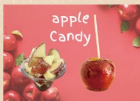
中井上商店 りんご館、ぶどう館