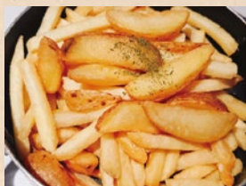
A&Mkichen 炭火焼鳥、ポテトフライ、アイス