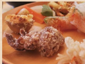
なのはな おにぎり、からあげ、ポテト