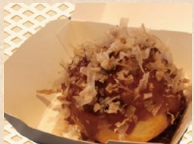
ブレーメン たこ焼き、めっちゃでかたこ焼き、 ドリンク類