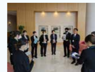
◀開場前の打合せの様子 公演内容の確認、スタッフの配置、サポートが必要なお客様や必要な備品の確認など、様々な情報を共有します。

ホールサポートスタッフは、ホール主催公演の際、チケットの確認や座席の案内などの接客業務を担う有償ボランティアです。お客様の声を直接聞く機会が多く、ホールを利用する側の視点を大事にしながらホールに携わってくれる、心強い応援団でもあります。