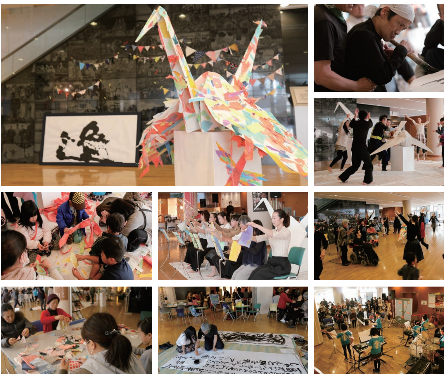
2016年度交流事業「初春☆夢を描こう、踊ろう。」2017年1月9日(祝)開催 新しい年の幕開けを様々なアート体験(表現)で、みんなでお祝いしました。 当日、出来上がった作品の一部はMJのロビーなどで展示しております。 ご来館の際は、ぜひゆっくりとご鑑賞ください。