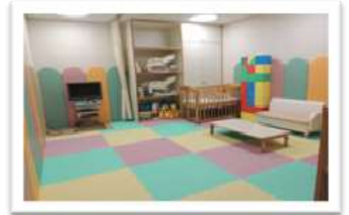
託児室は一階受付カウンター横にあります。